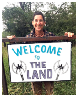
Saludadora desconocida de "Bienvenida a casa" a La Tierra (The Land)

Estoy haciendo las maletas para ir a tres festivales de mujeres-nacidas mujeres en La Tierra (The Land), en Walkerville, Michigan, el lugar donde el Festival de Música de Mujeres de Michigan todavía está consagrado en nuestra memoria desde 1982. Aunque ese festival creció hasta miles de participantes cada año (de 3.000 a más de 10.000 en el último festival de 2015 y en varios años de décimo aniversario), estos serán más pequeños, de 90 a 700, debido a las reglas de conservación de la tierra acordadas por la corporación sin fines de lucro a cargo del lugar. Aun así, muchas de las alegrías y las dificultades siguen siendo las mismas, como la alegría de crear comunidades físicas y espirituales con mujeres y la dificultad de soportar calor extremo durante el día, frío por la noche y lluvias torrenciales