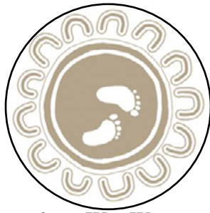
Wurundjeri Woi Wurrung Aboriginal Art

Corporación Aborigen de Concilio Terrenal, (Bunurong Land Council Aboriginal Corporation) (BLCAC) y Corporación Aborigen de Herencia Cultural (Wurundjeri Woiwurrung Cultural Heritage Aboriginal Corporation –WWWCHAC) han aceptado las variaciones propuestas por el Concilio Victoriano de Herencia Aborigen (Victorian Aboriginal Heritage Council) a sus límites de registro. 3.721 km de tierras y aguas a lo largo de Melbourne Distrito Central de Negocio (CBD) (Central Business District) y 24 ayuntamientos serán ahora formalmente atendidos