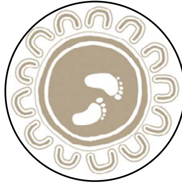
Wurundjeri Woi Wurrung Aboriginal Art

The Bunurong Land Council Aboriginal Corporation (BLCAC) and Wurundjeri Woiwurrung Cultural Heritage Aboriginal Corporation (WWCHAC) have accepted The Victorian Aboriginal Heritage Council's proposed variations to their registration boundaries. 3,721 km of Country and Waters across the Melbourne CBD (Central Business District) and 24 local councils will now be formally cared for and protected by the two Traditional Owner Groups.